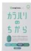
カラハリのちから 4,630 円