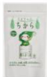
200 粒 10,400 円