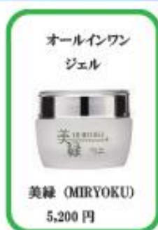
オールインワン ジェル 美緑 (MIRYOKU) 5,200 円